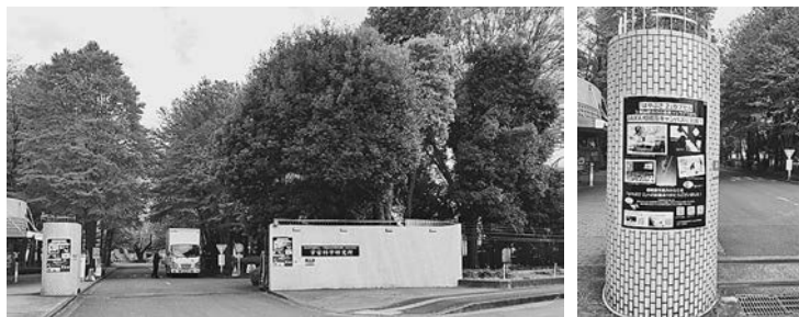
宇宙航空研究開発機構正門とはやぶさ2に関する掲示

JAXAの周辺は、道路の向かい側に相模原市立博物館があり、ここではやぶさ2の帰還カプセルが展示されました（令和3年3月12日）。市博物館と並んで国立映画アーカイブもありました。これは、国立近代美術館フィルムライブラリーが機能拡充して東京国立近代美術館フィルムセンターとなったもので、東京都中央区京橋を本館とし、当館はその分館になります。