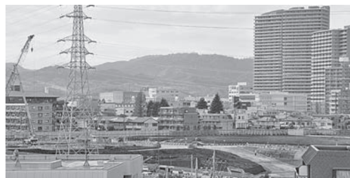
開削工事が始まっているリニア神奈川県駅予定地

相模原駅から2駅目の淵野辺駅から国道16号を渡る方向に向かうと、間もなく林間の広大な敷地に施設が見えます。宇宙航空研究開発機構（JAXA）相模原キャンパスです。小惑星「りゅうぐう」に着陸し、サンプル収集を行って地球に帰還した「はやぶさ2」のカプセルがJAXA相模原キャンパスに持ち込まれる映像が報道されましたが、こちらになります。