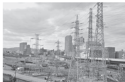
リニア関連工事（奥：JR・京王線橋本駅）