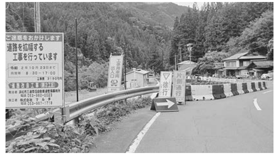
三遠南信自動車道の「現道活用区間」として改良工事が進められる国道152号（浜松市水窪池島地区）

現状、草木トンネルから水窪町にかけての道路は、一部に避け合いもできない幅員の箇所があるが、間もなく遠山地区のような線形の整った道路になるものと思われる。