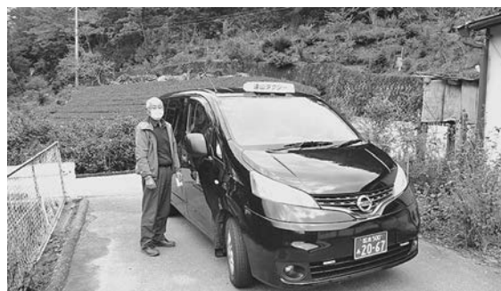
乗合タクシー八重河内線 かぐらの湯～柿平 300円 (当日、乗合タクシーは利用できず)

終点かぐらの湯に予定の11時00分をやや遅れて着。ここから八重河内へ向けて乗合タクシー八重河内線があるが、困ったことが判明した。八重河内線の運行は平日のみ。乗合タクシーを利用したければ平日に行く必要があるが、平日には午前中の広域バス遠山郷行きはない。乗合タクシーを土日にも、と思うが、私のような気まぐれな旅人は対象外なのだ。