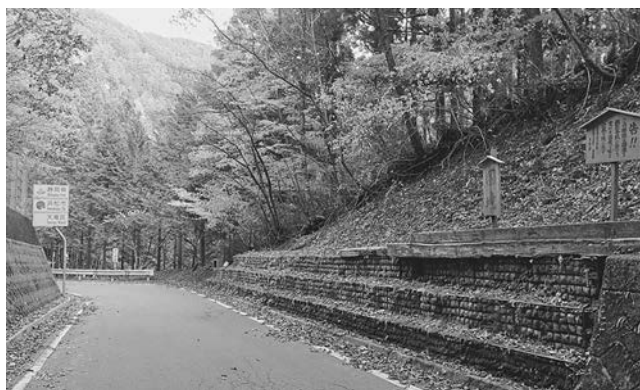
「峠の綱引き」の市道兵越線兵越峠