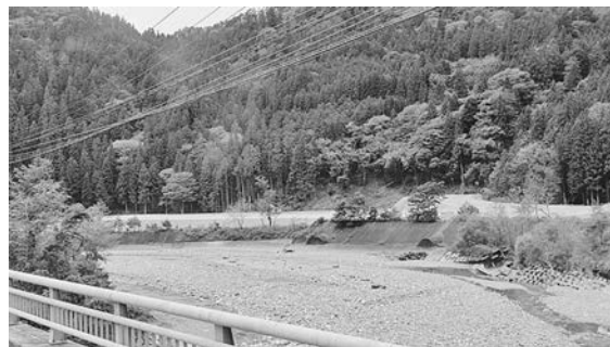
青崩トンネル発生土置き場（南信濃小道木）

矢筈トンネルから先は改良された国道152号を走るが、木沢の先の熊野大橋のところから旧道に入り小道木地区を通る。この先の大島集落のバス停などに停車するためだ。久しぶりに改良前の和田へ行く旧国道を通った。途中「あれが青崩トンネル工事で出るズリ（発生土）置き場」と運転手が案内してくれた。一部は青崩トンネルへの接続道路工事で再利用の予定があるという。