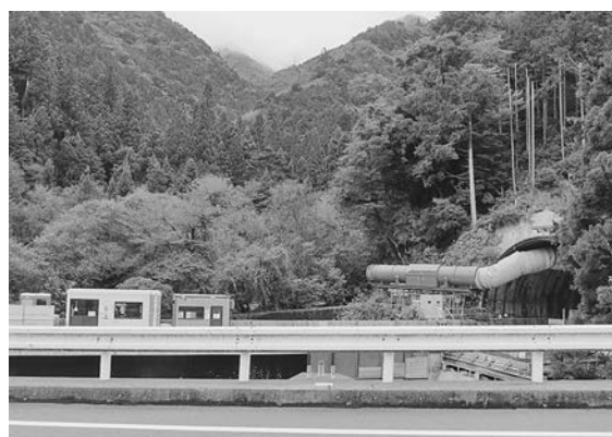
青崩トンネル本抗工事現場 (浜松市水窪池島地区)

この日のこの時間帯の市道兵越線は、浜松側から信州を目指す車両台数のほうが多く、自動車台数よりバイクの台数のほうが多い印象だった。