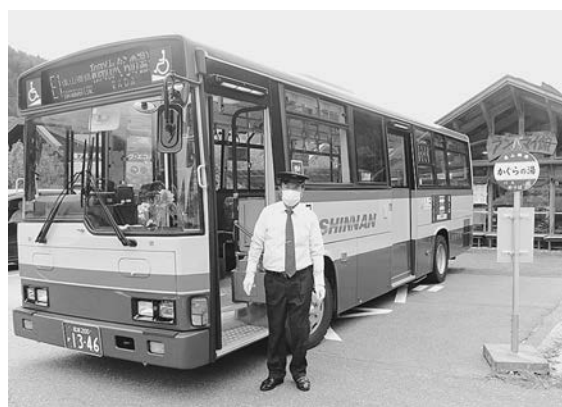
広域バス遠山郷線 飯田駅前～かぐらの湯 700円

飯田駅前から定刻に出発。下農入り口、OIDE長姫高校前、市立病院、弁天、富田辻、氏乗、矢筈トンネル、上村上町、南