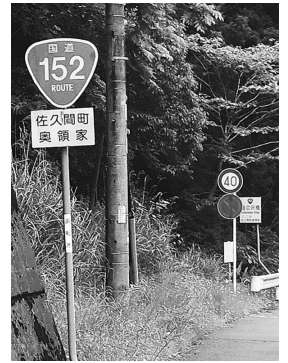
町内に残る歴史地名