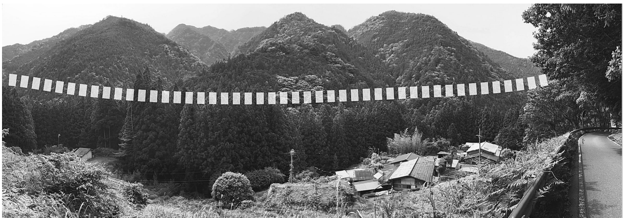
国土交通省中部地方整備局浜松河川工事事務所の資料を基に、三遠南信道の概略位置を表示（右手道路が県道290号）

今回訪れた静岡県道290号沿いは、中央構造線による断層地形が当地域の大鹿村を思い起こさせ、歴史（「鎌倉殿の13人」の世界）と地学（「ブラタモリ」同）に関係した事物が多くみられる一帯だった。