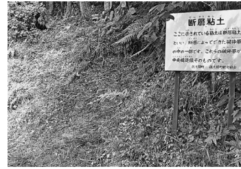
北条峠 中央構造線の活動による破砕帯の粘土（上）と黒色片岩（右）の露頭

その昔、佐久間・水窪一帯は「山香荘」という後白河法皇が御所内に設けた長講堂（法華長講弥陀三昧堂）の荘園であった。その後武士が台頭、鎌倉幕府は承久の乱を契機として山香荘に地頭を配置する。地頭が荘園内の支配を強めると荘園領主との争いが起き、その解決として荘園と地頭の支配地を取り決めた（下地中分）。それにより前者が「領家」、後者が「地頭方」となり、その名称が現在まで北遠地域に地名として残る。領家地名が内帯側に在ったことから、内帯の代表的な地質にこの「領家」が付された。下地中分の際、領家と地頭方の境が北条峠と定められ、ここに「傍示」つまり境を示す標識を設置したことから「ホウジ峠」と呼ばれ、その後「北条峠」に転化した（「佐久間町史」）。