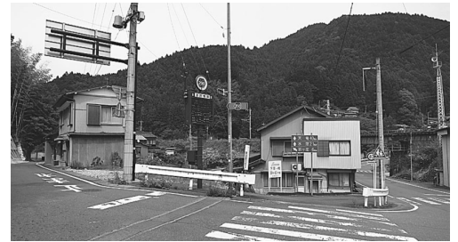
県道290号の佐久間町国道473号との分岐点 左 県道290号、右 473号・152号経由で水窪へ

当南信州地域にも良いニュースとあって早速、三遠南信道 水窪佐久間道路の予定地を訪問した。