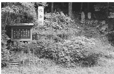
静岡県道290号 北条峠