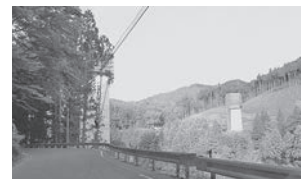
写真② 付替国道257号橋脚