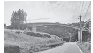
写真③ 付替県道10号橋脚