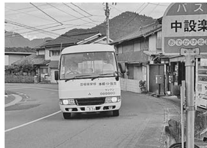
中設楽バス停とおでかけ北設 豊根東栄線 中設楽～布川 100円