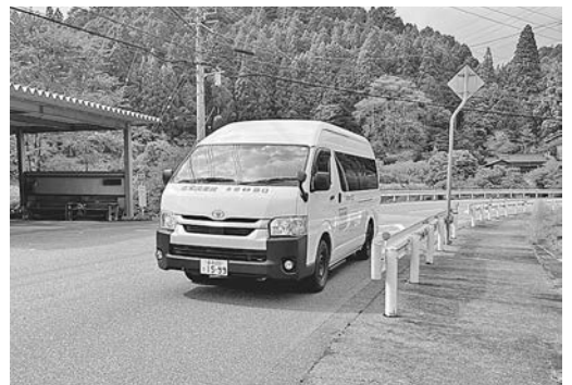
神田バス停とおでかけ北設 東栄設楽線 神田～中設楽 100円