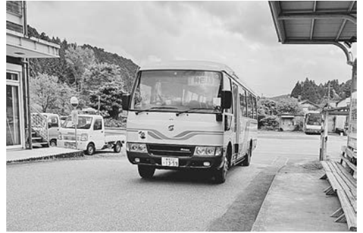
おでかけ北設 東栄設楽線 田口～神田 300円