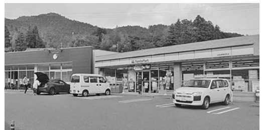
東栄町中設楽 バス停は店舗の反対側にある