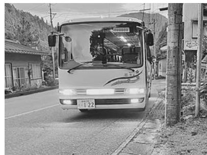
金越バス停とおでかけ北設 坂宇場線 金越～豊根中村 200円