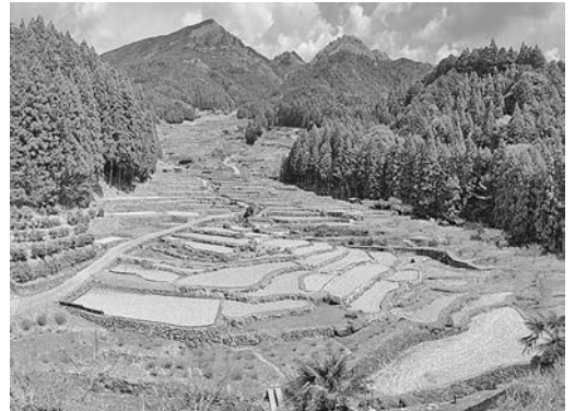
日本棚田百選 四谷千枚田