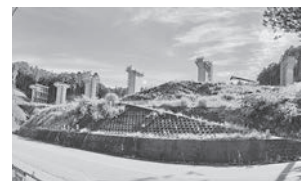
写真① 付替県道10号橋脚