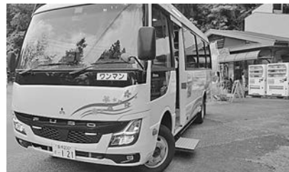
布川バス停とおでかけ北設 豊根東栄線 布川～金越 300円