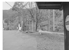
中川バス停 根羽・浪合方面への分岐

次の中川は和知野ダムを望む根羽方面（県道阿南根羽線）と浪合方面（県道深沢阿南線）の分岐のところだった。