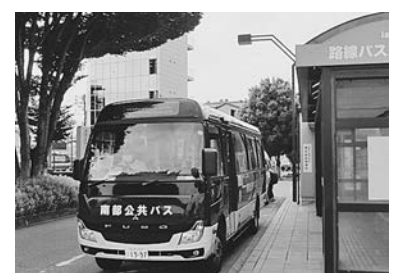
飯田駅前に到着、路線バス旅の完結 新野東町～飯田駅前 600円

南部公共バスは飯田市民の利用は想定されていないので、そこから先のバス停は数少なく、駄科下平、八幡様前くらい。その先の飯田市立病院、OIDE長姫高校前、下農入口など南部住民の目的場所にバス停が設定されている。浜松を目指して乗った遠山郷線では県立公民館前の道路を通ったが、このバスは県公民館前を過ぎて県道230号(県さわかロード)へ右折し、下山通りへ出る。そのまま進むといよいよ飯田市街、東中央通りを進み、中央交差点を過ぎると中央広場、そして飯田駅へ。バスの終点は飯田病院前であるが、ここで飯田駅→浜松駅→豊橋駅→と巡る三遠南信地域路線バス乗り継ぎの旅の終点に至ったのであった。