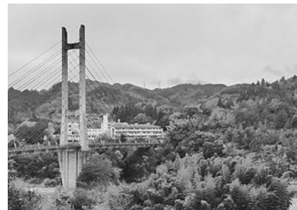
温田駅から望む南宮大橋と阿南町中心部

三遠南信地域路線バス乗り継ぎの旅は、いよいよ最終章、豊橋駅・飯田駅間のうち新野から飯田駅まで。バス旅の完結を迎えることとなる。当飯伊地域の皆さまでも南部公共バスをご存じの方は少ないと思われるので、このバス路線を重点的に紹介したい。