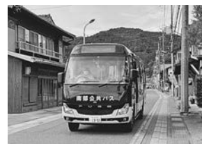
新野東町バス停と南部公共バス

宿所を出発し、最寄りの東町バス停9時29分発のバスに乗る。新野出張所前、駐在所前、赤石寮入口といった新野の平（千石平）を通過し山を下っていく。ループトンネルを過ぎた先で、「次は帯川」というアナウンスがあったかと思うと、バスは国道を外れてランプウェイを下りて行く。あ、国道151号が新野まで道路改良が行われていた頃、旧151号から改良済みの区間に乗り入れた道路だ、と判った。そのまま進んで帯川の集落にあるバス停に止まる。